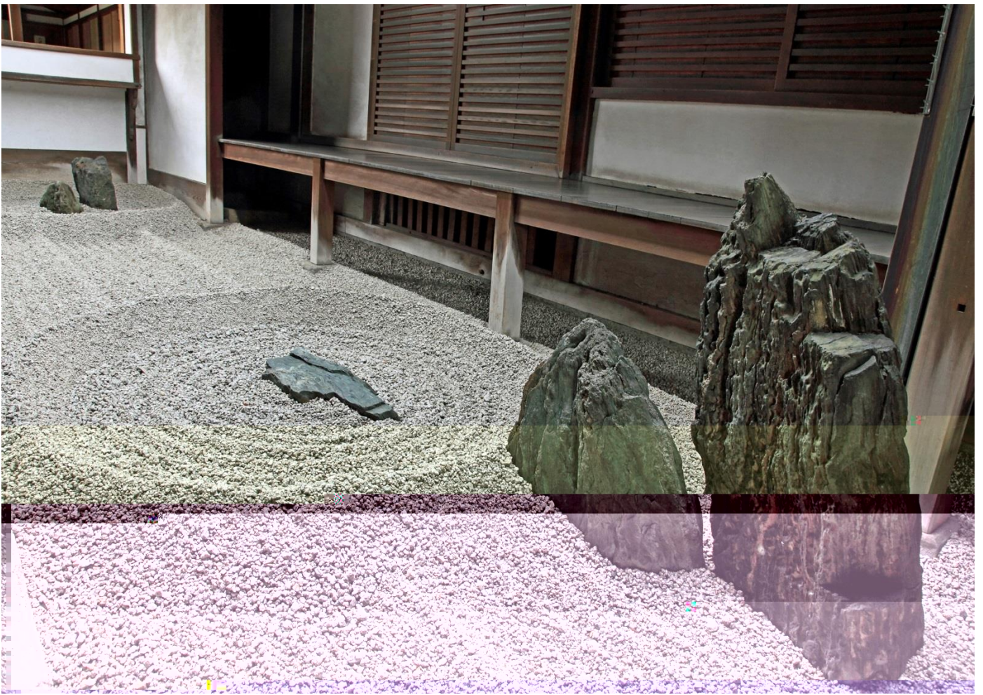
方丈側から座して鑑賞すると、表情豊かな立石が万丈の滝に見えてくる。