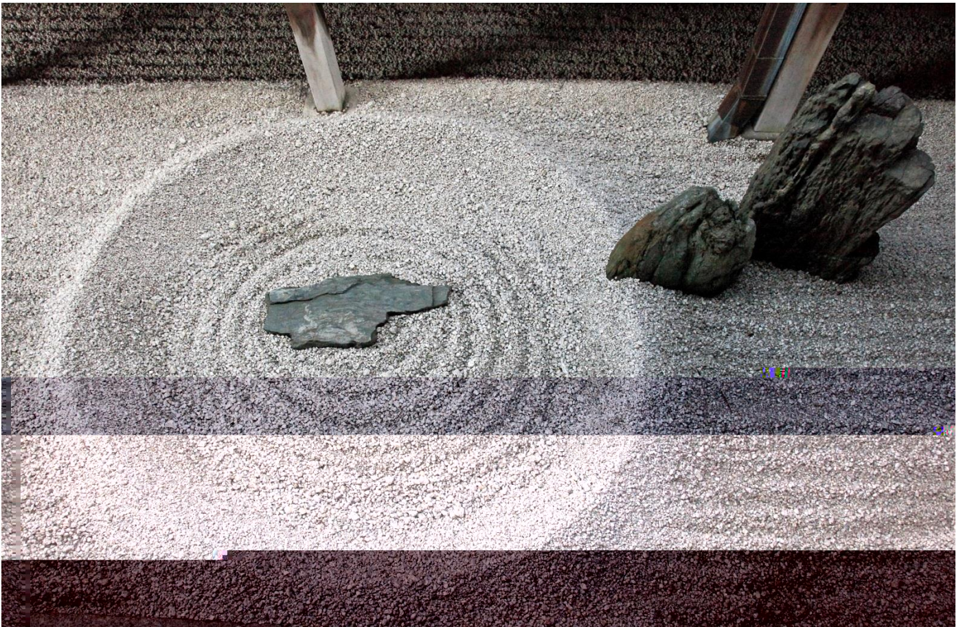
波紋の中心の造形は新鮮な美しさ。