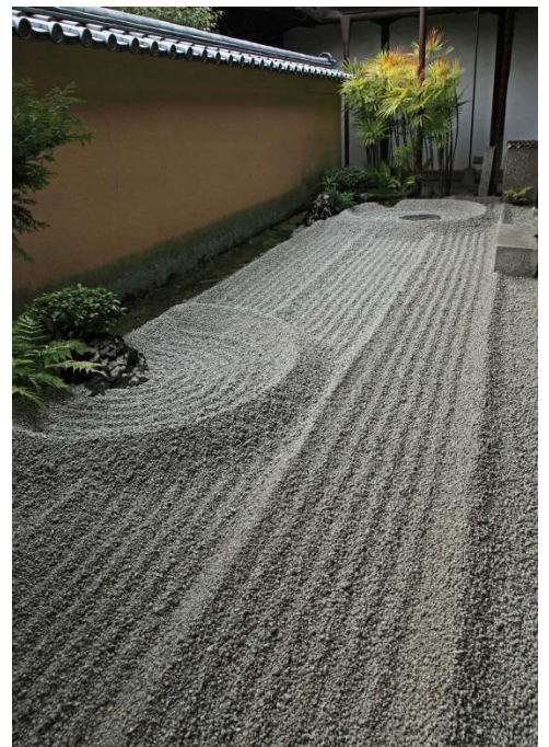
南側軒下の溲沱底（こだてい）