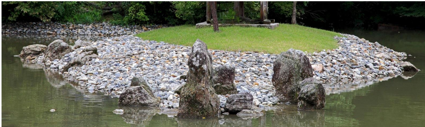
荒磯を上記写真とは直角方向から見た景