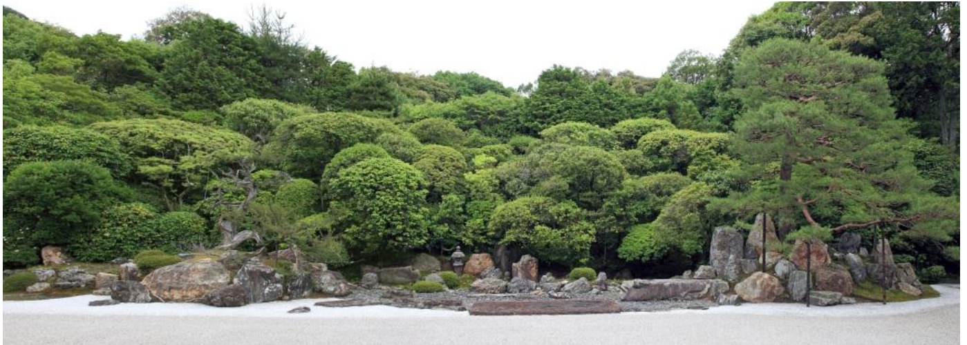
全景 一対の鶴島(右)・亀島(左)を配し、中央に遙拝石と蓬莱山を組んだ小堀遠州枯山水の傑作。

鶴島は鶴首石で鶴を象徴して秀逸であり、さらに鶴の背には三尊石組による羽石の造形や、その他に多くの色石が組まれ圧巻である。亀島は伏せた形の亀頭石は力強く迫力がある。亀甲石は三宝院のそれと類似した名石だ。また亀の背に聳えている柏槇(びやくしん)は聖樹であり、その姿は荘厳ともいふべきか。