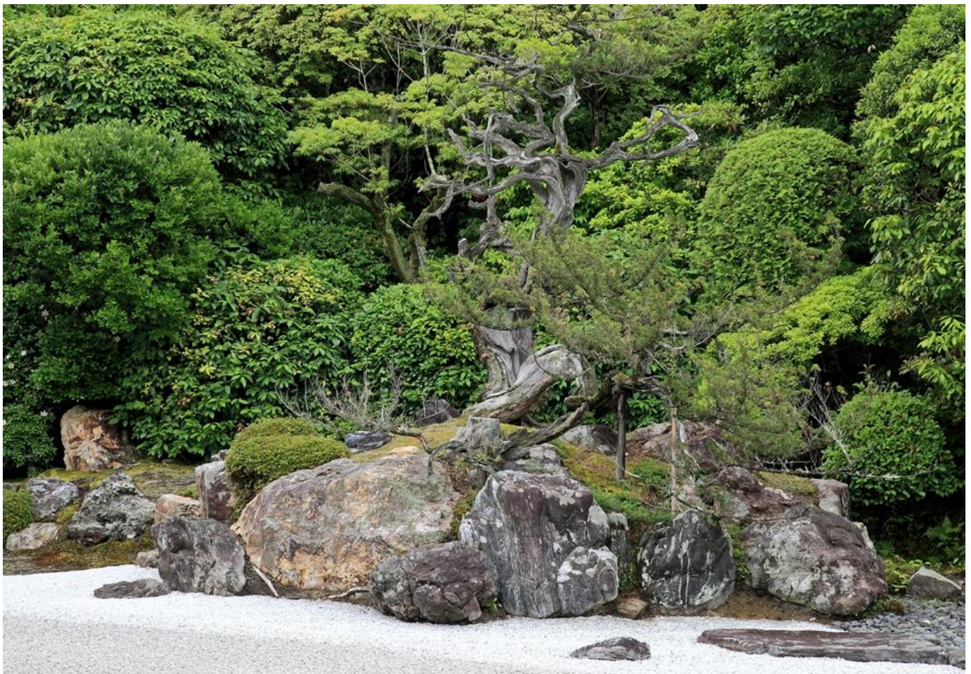
亀島：低く頭を下げた力強い亀島。亀の背には柏槇の樹齢700年とも云われる古木があるが、禅寺に相応しい風格である