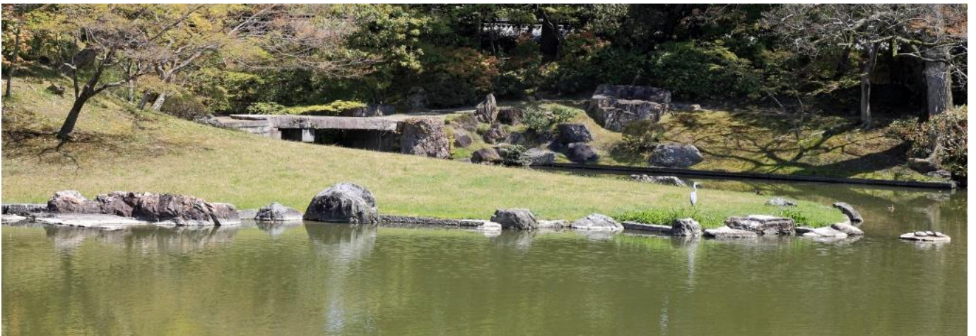
仙洞御所の洲浜：仙洞御所で唯一残る遠州の切石の幾何学造形