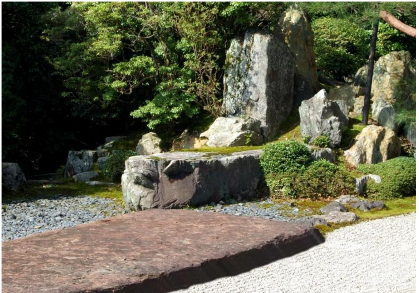
鶴島と遥拝石：鶴首石と鶴の背に乗る三尊形の羽石。直方体の鶴首石と羽石が直交する造形は遠州ならではの斬新な試み