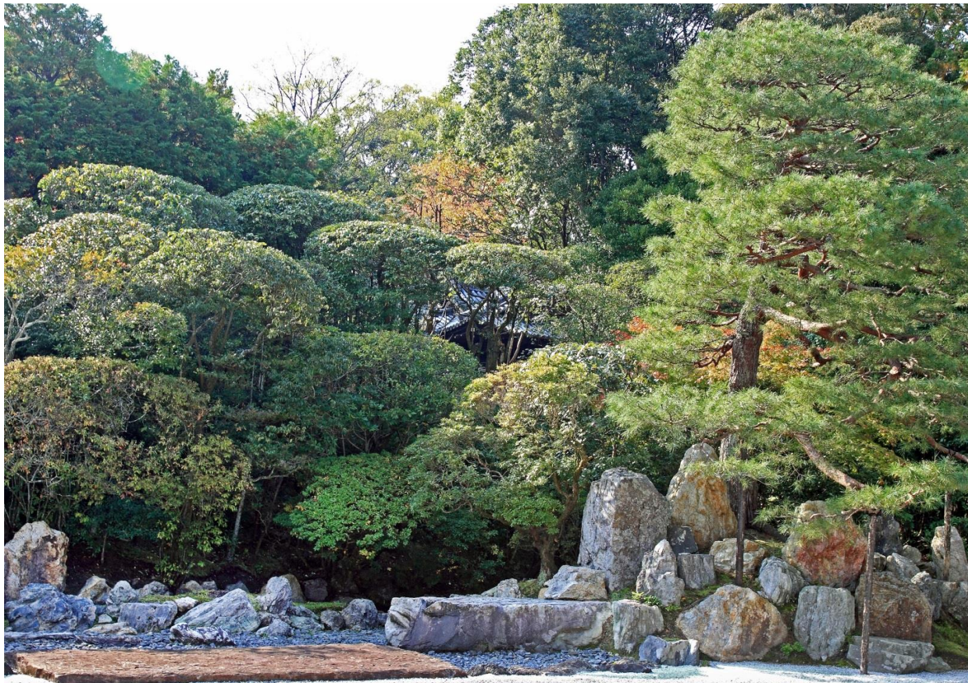
庭園の背後にある東照宮が見えるように、近年植栽の選定がされた。