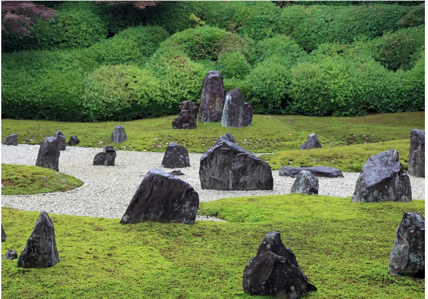
方丈からの全景 正面三尊石組の中心石からの光明線上に石を配置した。