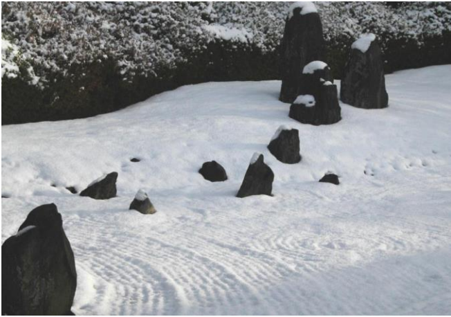
夕日に映える美しい雪紋も新しい造形だ