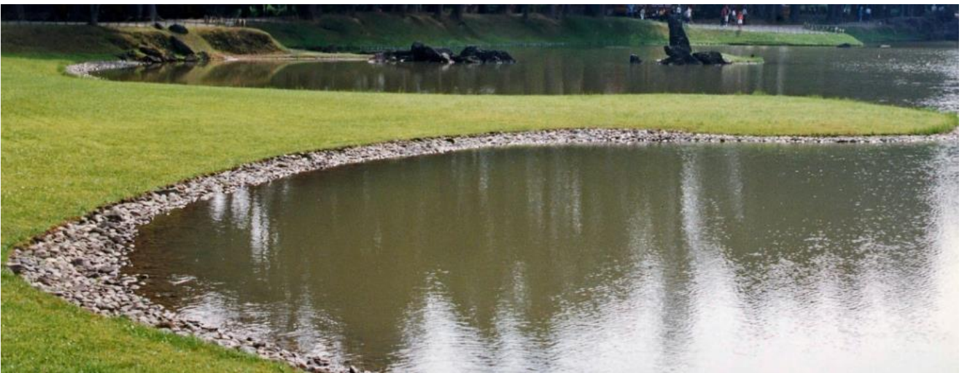
毛越寺 昭和13年に重森が毛越寺で干潟模様を発見した。光明院はこの意匠を枯山水に応用した最初の庭である。