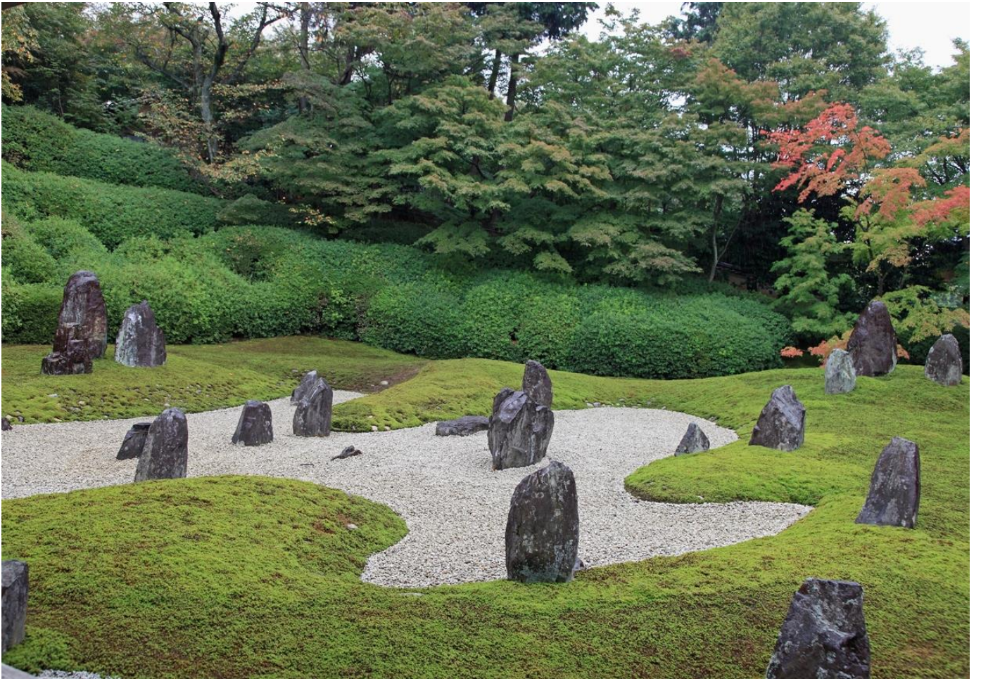
美しい洲浜と光明の線上にある石組。背後のツツジは雲紋を表した大苺込。