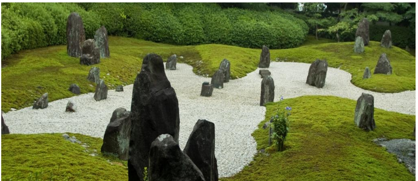
枯山水庭園における初めての洲浜庭園。また、三尊石は三組もある。