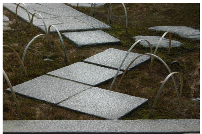
御輿寄せに向かう延段のデザインは角(すみ)違いの手法