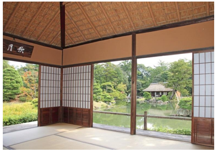
月波楼 鎌形の手水は実りの秋を表わしている