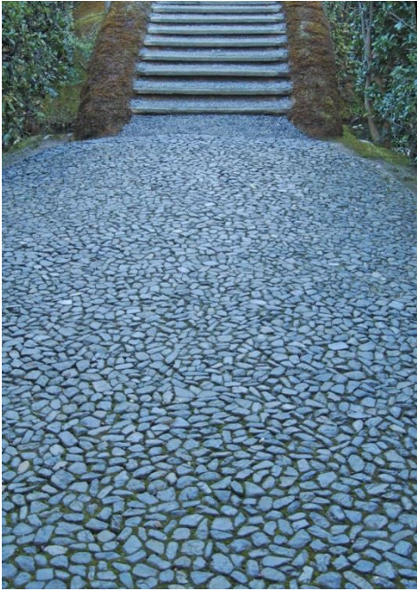
霰こぼしの延段は土橋とは中心線を変えているが、遠近法効果を狙っている