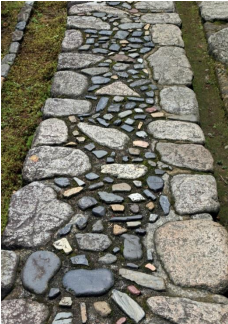
笑意軒横の「草の延段」の色彩に注目