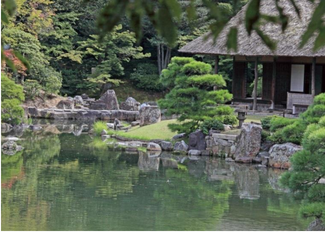
松琴亭 松琴亭の松は冬を表わす

亭樹は下記写真のほかに卍亭もあるが、飛石、延段、舟で巡りそれぞれの風景を楽しむ。亭樹は春夏秋冬を象徴。