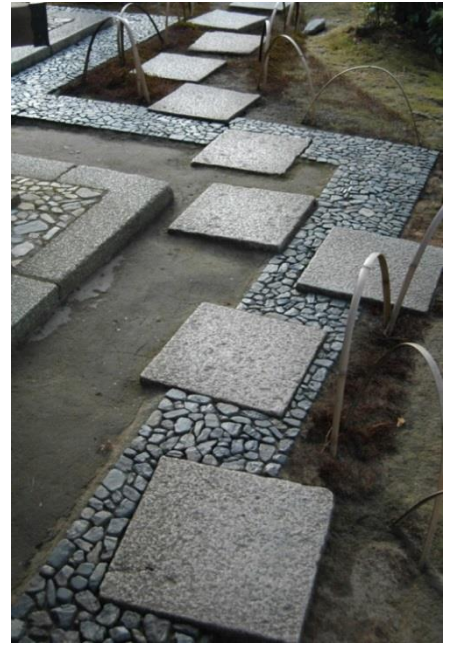
園林堂横の斬新なデザイン