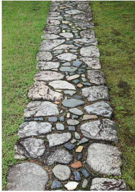
古書院前の「草の延段」