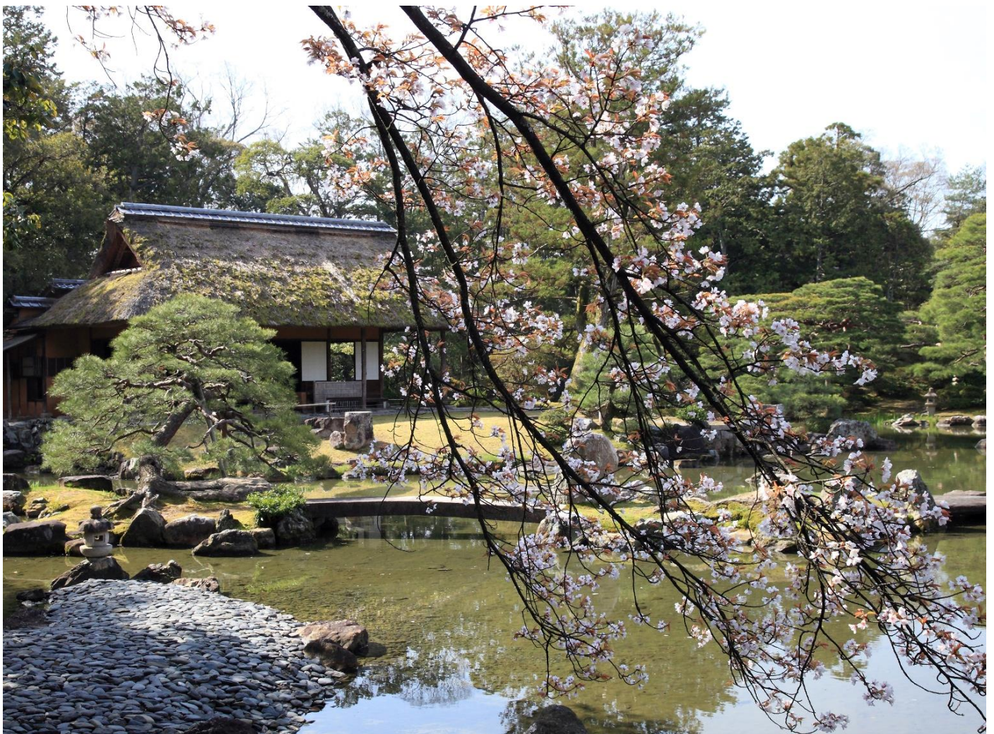
当庭は自然風景の縮景ではなく、人工的な洲浜の先にアクセントとして灯籠や人工的な切石橋で天橋立を繋げている