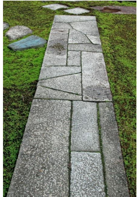
御輿寄せ前の「真の飛石」