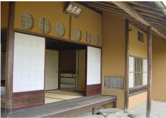
笑意軒 襖の雲海(写真中央の奥)は夏を表わしている