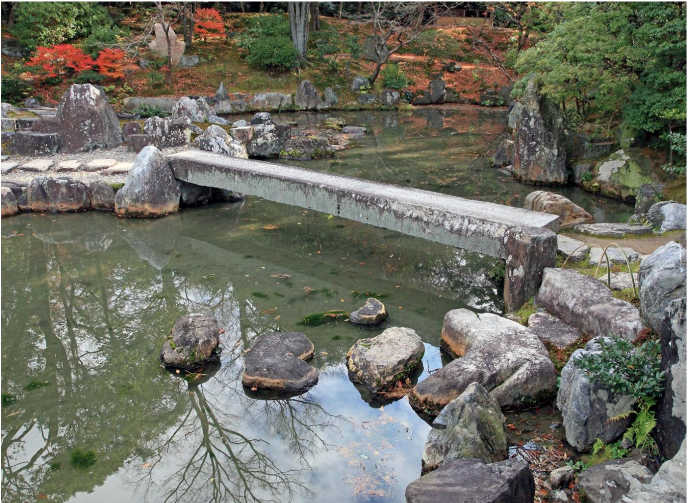
二河白道の白い橋(長さ6m、幅0.7m)。橋の奥の護岸にある火炎状の尖った石は、赤い火の川を象徴し、橋の手前の白い石の川がある(流れ手水)。行人は釈迦の教えを信じ阿弥陀の世界に渡る。