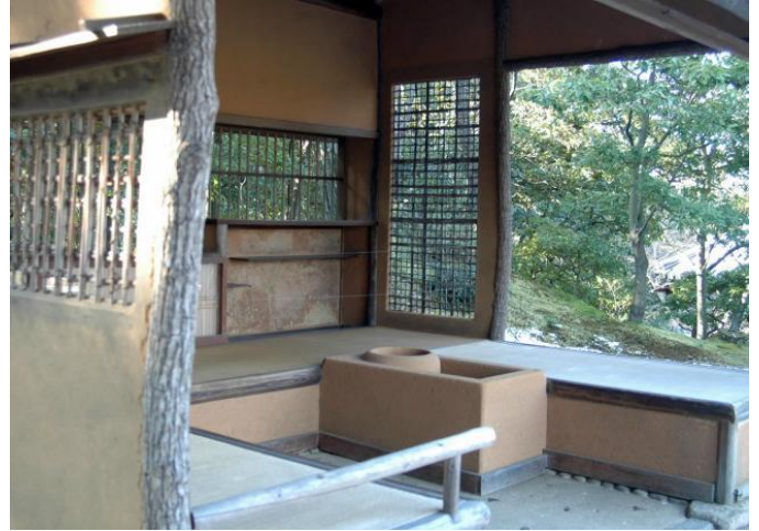
賞花亭 賞花亭の花は春を表わしている