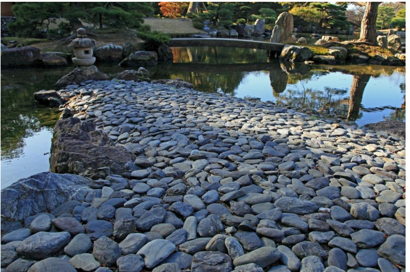
栗石のみの洲浜は、新しい感覚の造形である